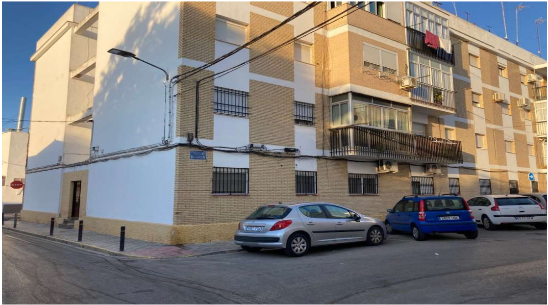
Edificio exterior Barriada El Matadero, 4 de Utrera (Sevilla)