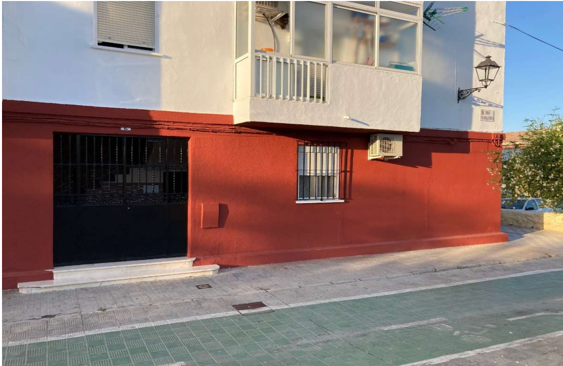
Calle Guadalquivir, Bloque 2, Utrera (Sevilla)