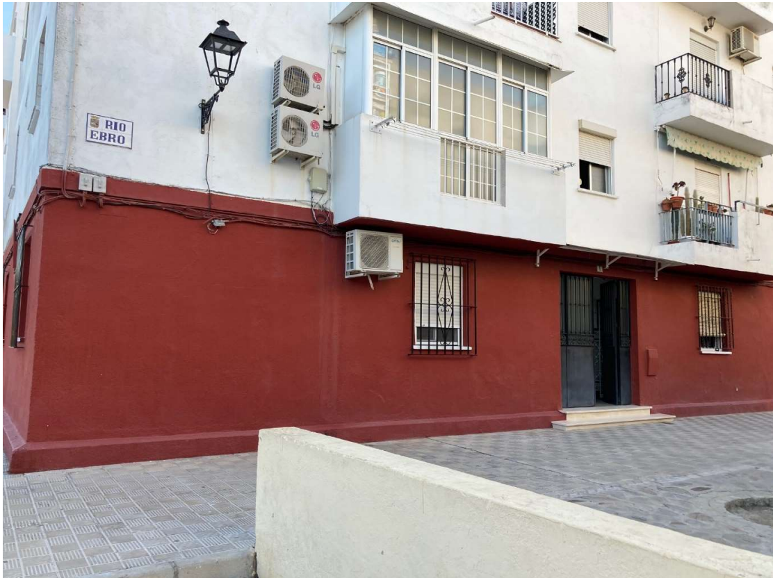
Calle Ebro, Portal 1, Bajo Derecha en Utrera (Sevilla)

Calle Guadalquivir, Bloque 2, Utrera (Sevilla)