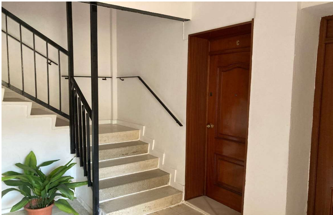
Barriada El Matadero, 4, Bajo C de Utrera (Sevilla)

DOMICILIO FISCAL: PLAZA DE GIBAXA, 1 DOMICILIO ADMINISTRACIÓN: C/. VERACRUZ, 72 41710 - UTRERA (SEVILLA) TELÉFONO: 636022300 / 954860050