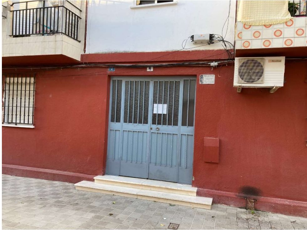
Calle Ebro, Portal 4, 3º Derecha Utrera (Sevilla)

2.2.- 52 Viviendas, situadas en Avda. Brigadas Internacionales, Bloques del 1 al 7 en Utrera (Sevilla), propiedad de la Junta de Andalucía, por las que la Fundación tiene un Convenio de la Encomienda de Gestión por parte del Excmo. Ayuntamiento, aprobado en Junta de Gobierno Local, de este Ayuntamiento, en Sesión Ordinaria, celebrada el día 21 de Septiembre de 2018. PUNTO 13º.2.- (EXPTE.577/2018).- Existiendo previamente un convenio entre la Junta de Andalucía y el Ayuntamiento por estas viviendas.