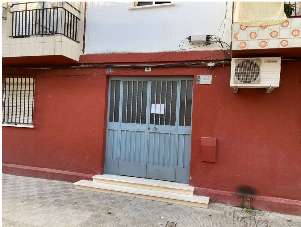
Calle Ebro, Portal 4, Utrera (Sevilla)