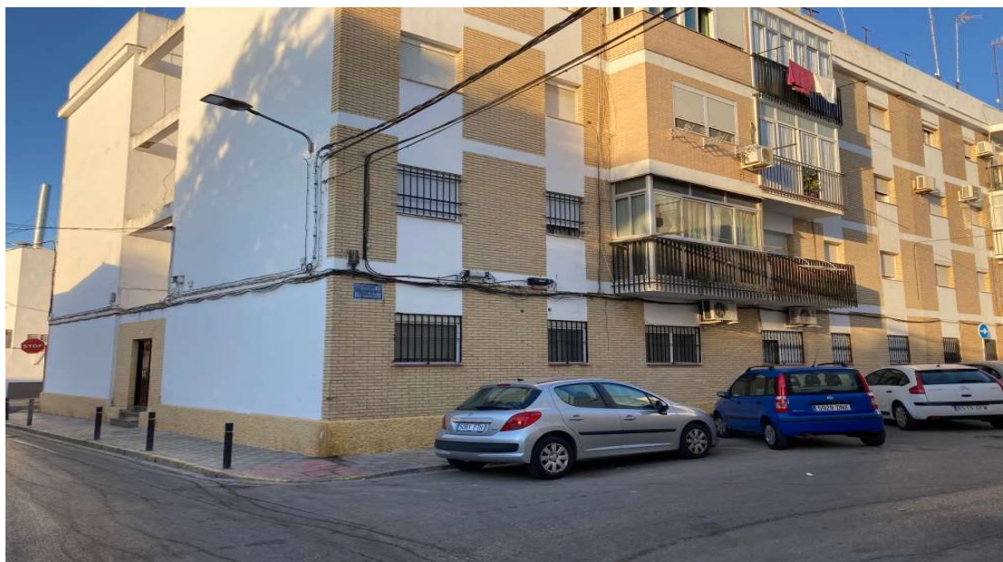
Edificio exterior Barriada El Matadero, 4 de Utrera (Sevilla)