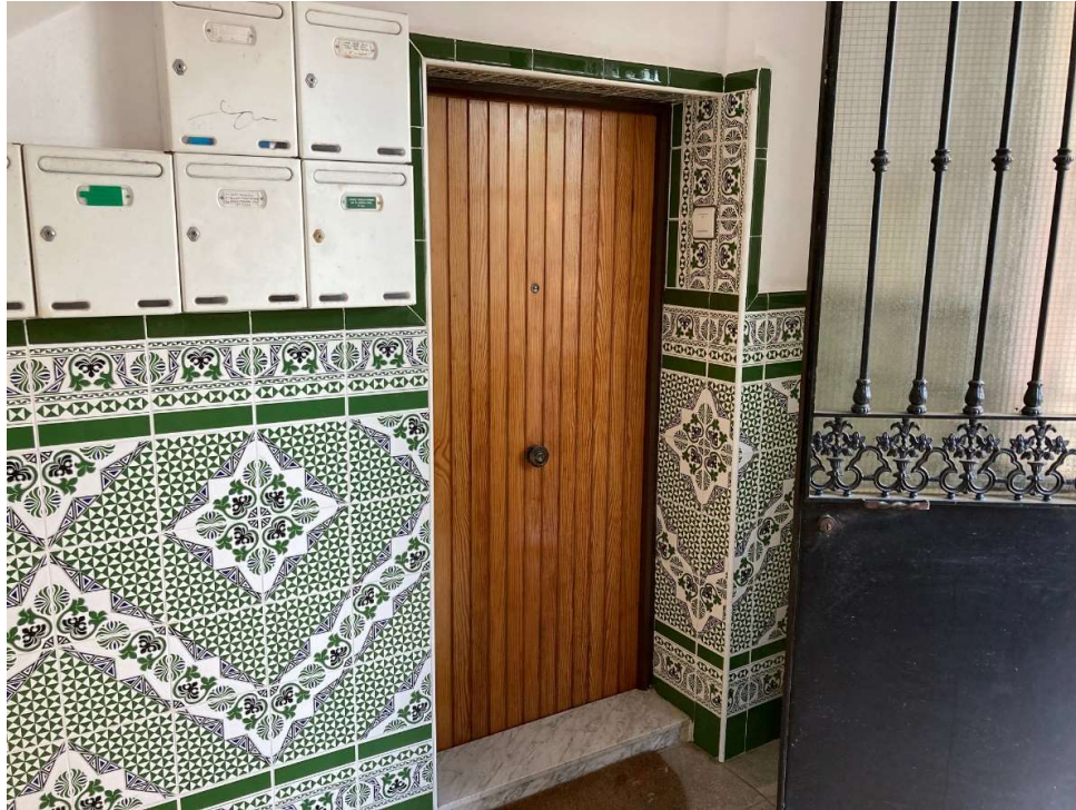
Calle Ebro, Portal 1, Bajo Derecha en Utrera (Sevilla)