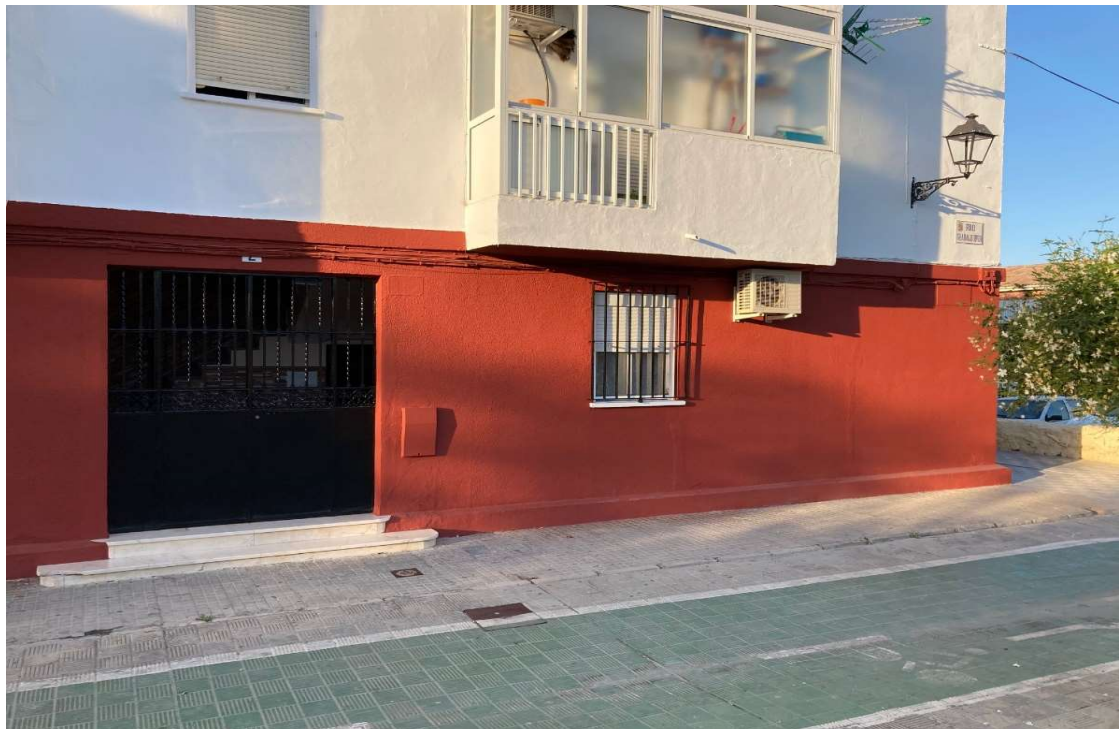
Calle Guadalquivir, Bloque 2, Utrera (Sevilla)