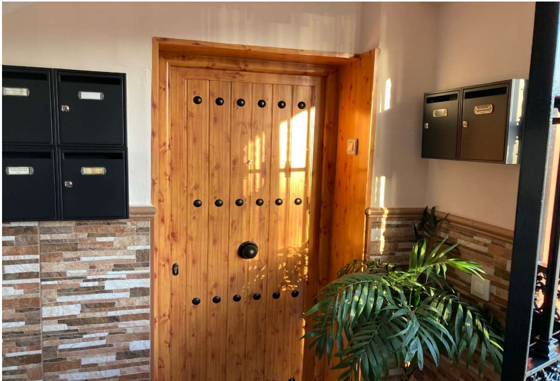
Calle Guadalquivir, Bloque 2, Utrera (Sevilla)