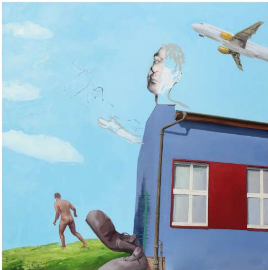
SINERGIA - 1 Jabi Machado Óleo/Tela. 100 x 100 cm.