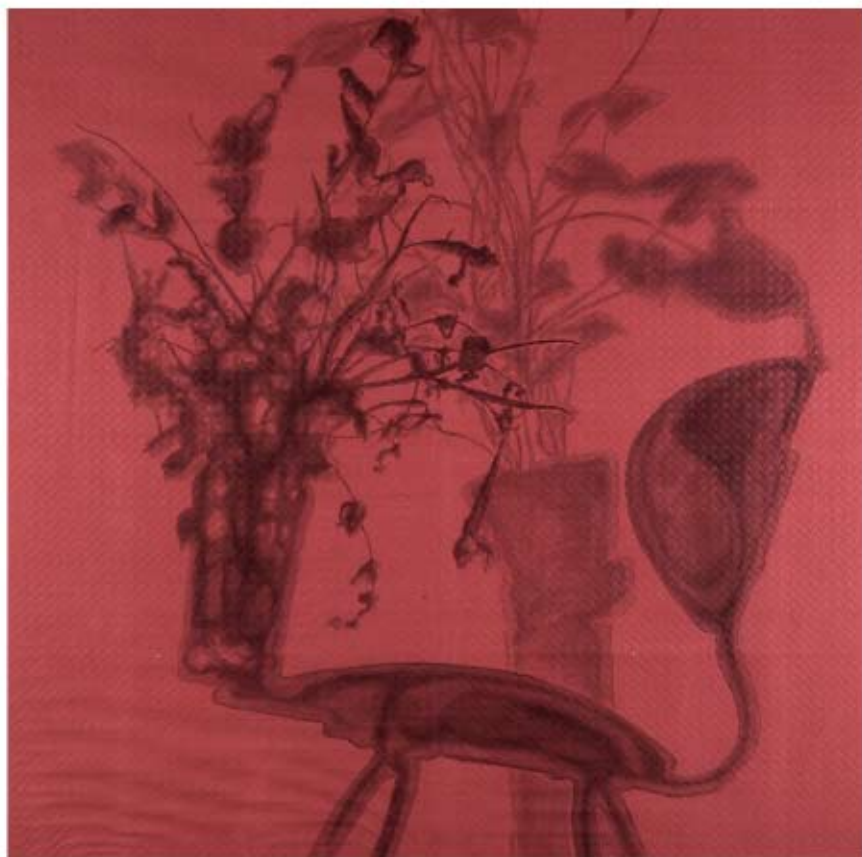
BODEGÓN EN EQUILIBRIO Jaime Lorente Sainz Grafito/Mantel rojo. 100 x 100 cm. Adquirido