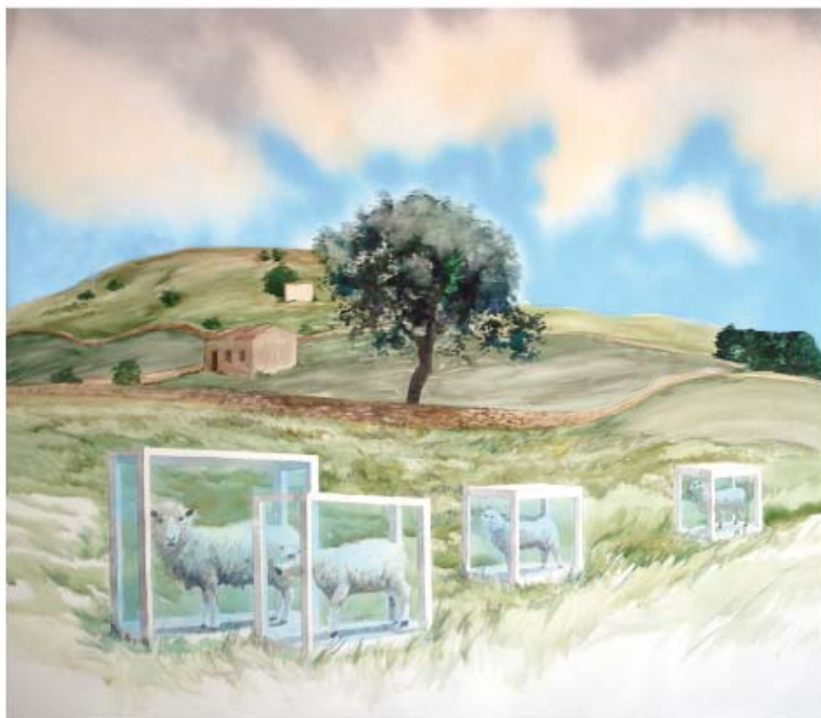
DEVONSHIRE Cristóbal Quintero Acuarela y spray/Papel. 160 x 130 cm.