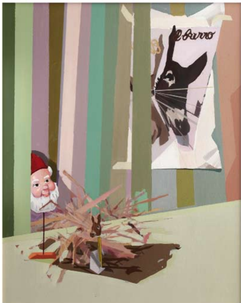
EL BURRO Rafael Guerrero García Acrílico/Tela. 73 x 92 cm. Adquirido