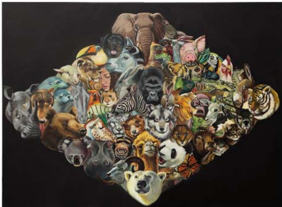
YO COMO NOÉ Montse Caraballo Óleo/Tela. 80 x 60 cm. Adquirido