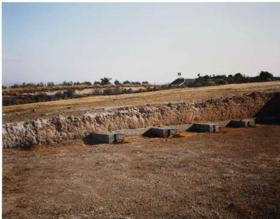
A-92, Km113 (SERIE: EN EL CAMINO) Jorge Yeregui Fotografía color/Dibond. 180 x 150 cm. Adquirido