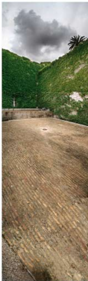
SEVILLA 20 Eduardo D'Acosta Fotografía digital. 60 x 170 cm.