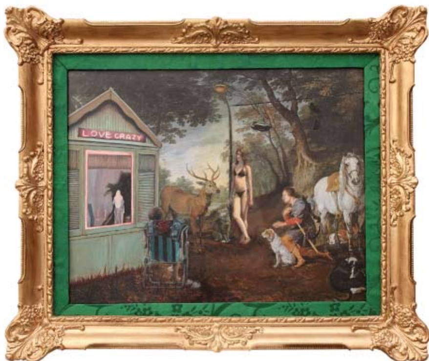
LOVE CRAZY Aurora Rumí Collage y óleo/Tabla. 90 x 76 cm.