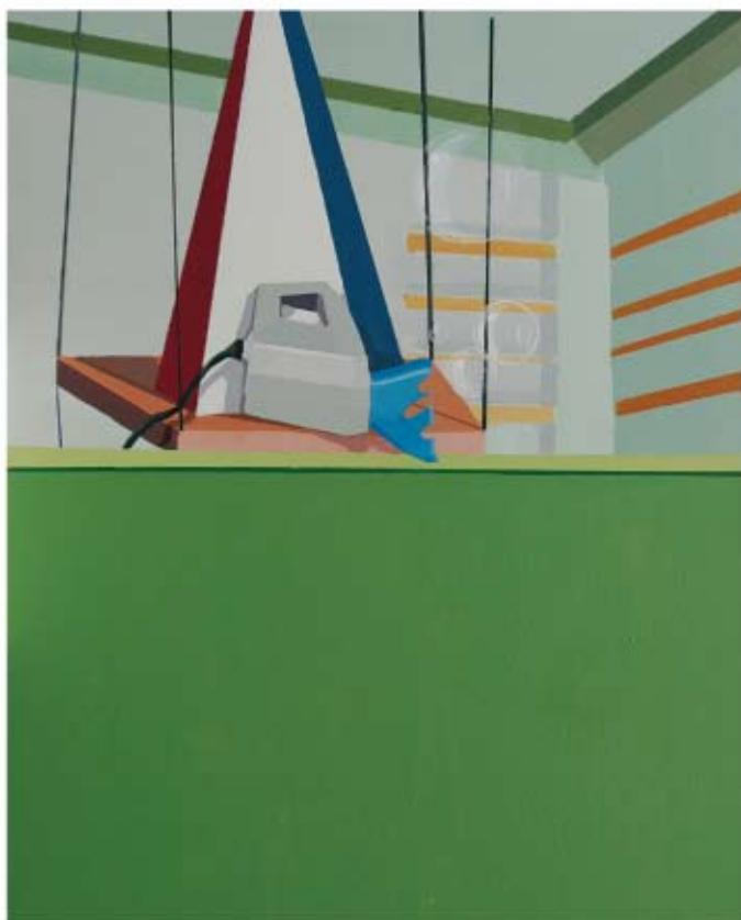
FIESTA Rafael Guerrero García Mixta/Tela. 80 x 100 cm Adquirido