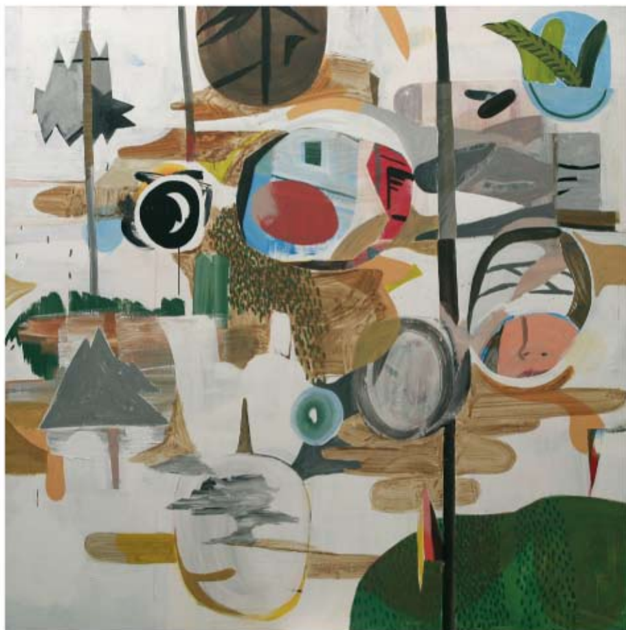
EN LA BRECHA José Vicente Losada Martín Mixta/Tela. 200 x 200 cm