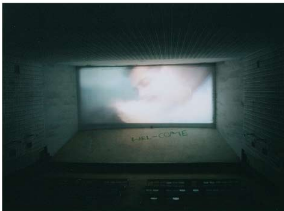
SIN TÍTULO #1 Miguel Romero Fotografía color/Papel seda. 52 x 43 cm Adquirido