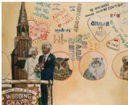
CONTIGO PAN Y CEBOLLA Montse Caraballo Caro Óleo/Tela. 46 (2) x 38 (2) cm