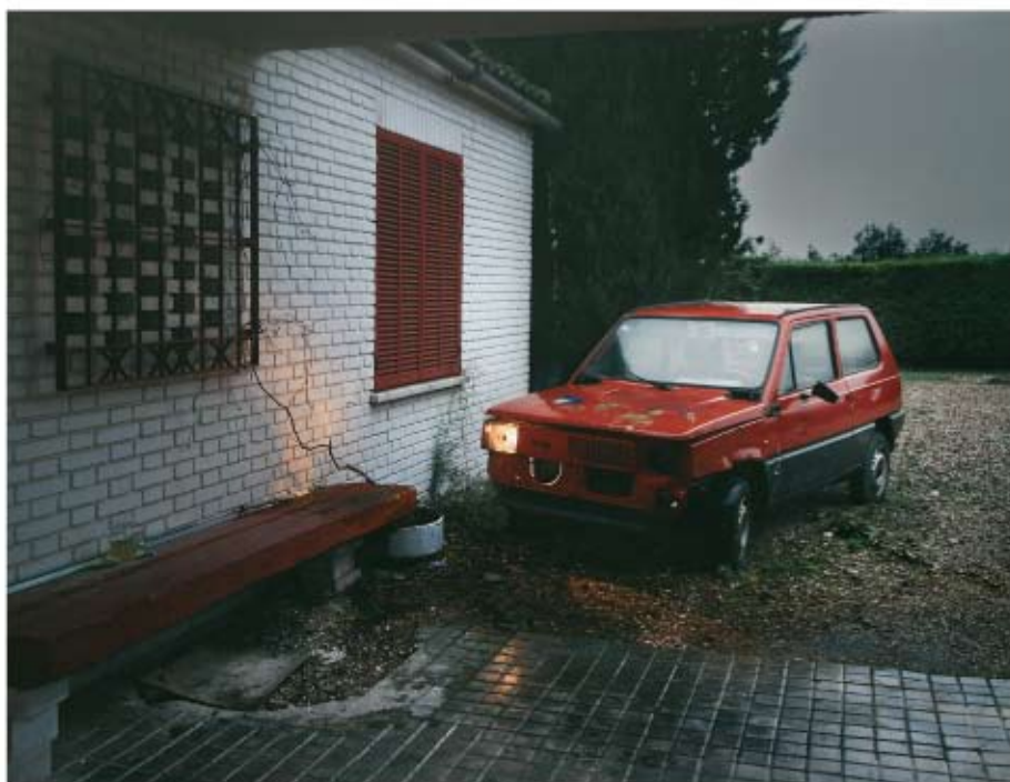
UTOPIÍA III Mónica Desiree Giclée/Foam. 137 x 108 cm Adquirido