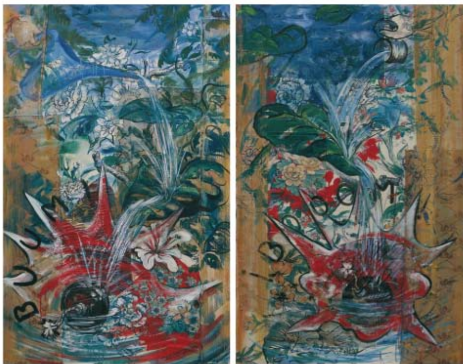
BOMB-FLOWERS Rocío Arregui Pradas Óleo/Patchwork.. 73 (2) x 116 cm Adquirido