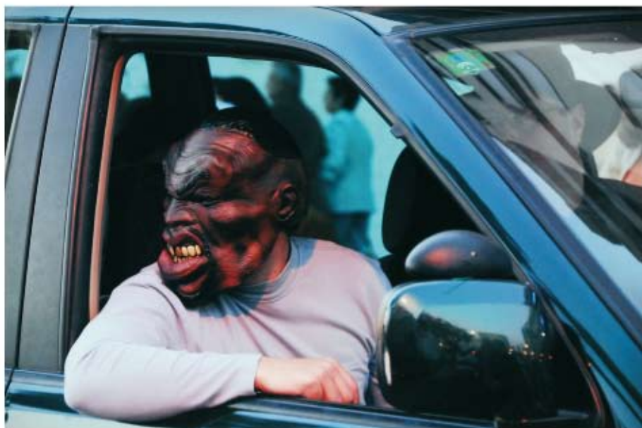
CARA-BANA Julio Herrera Fotografía Digitalizada. 45 x 30 cm