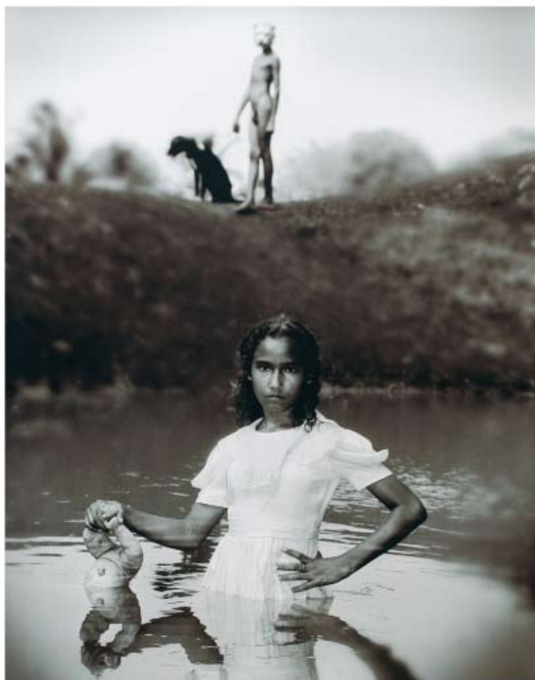
AQUEL LUGAR... Alexis Edwards Fotografía. 120 x 150 cm