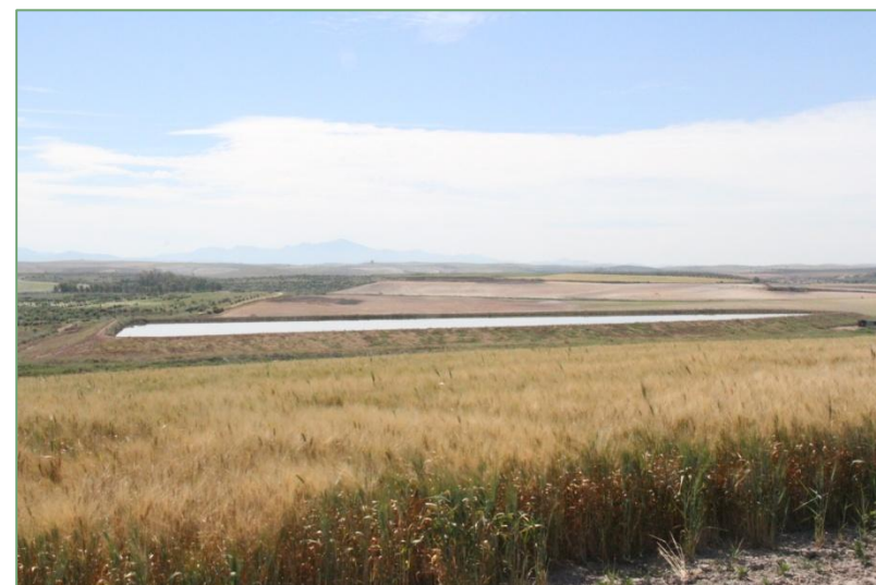
Laguna de La Ventosilla