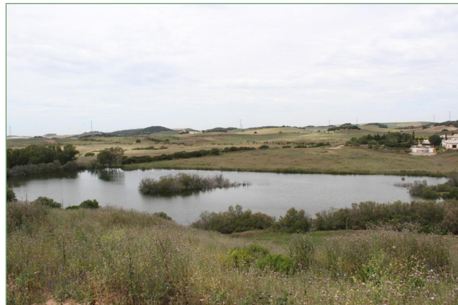
Laguna de Las Capellanías