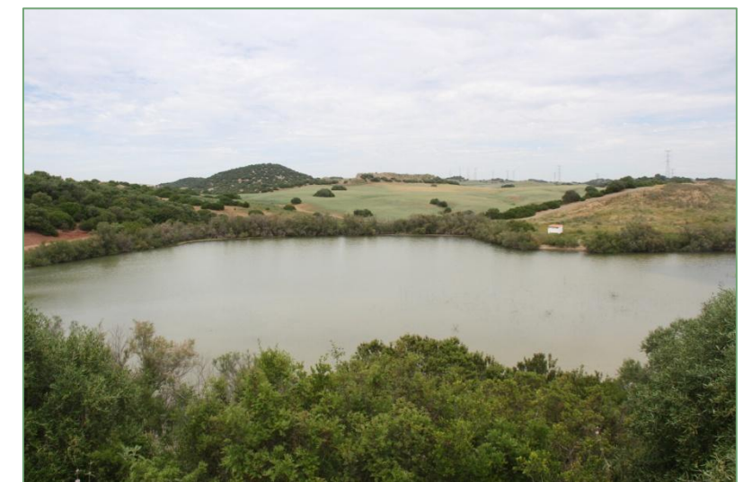
Laguna de El Carmen